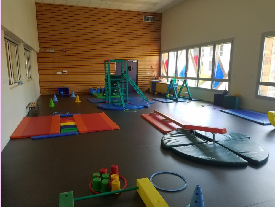
Salle de motricité